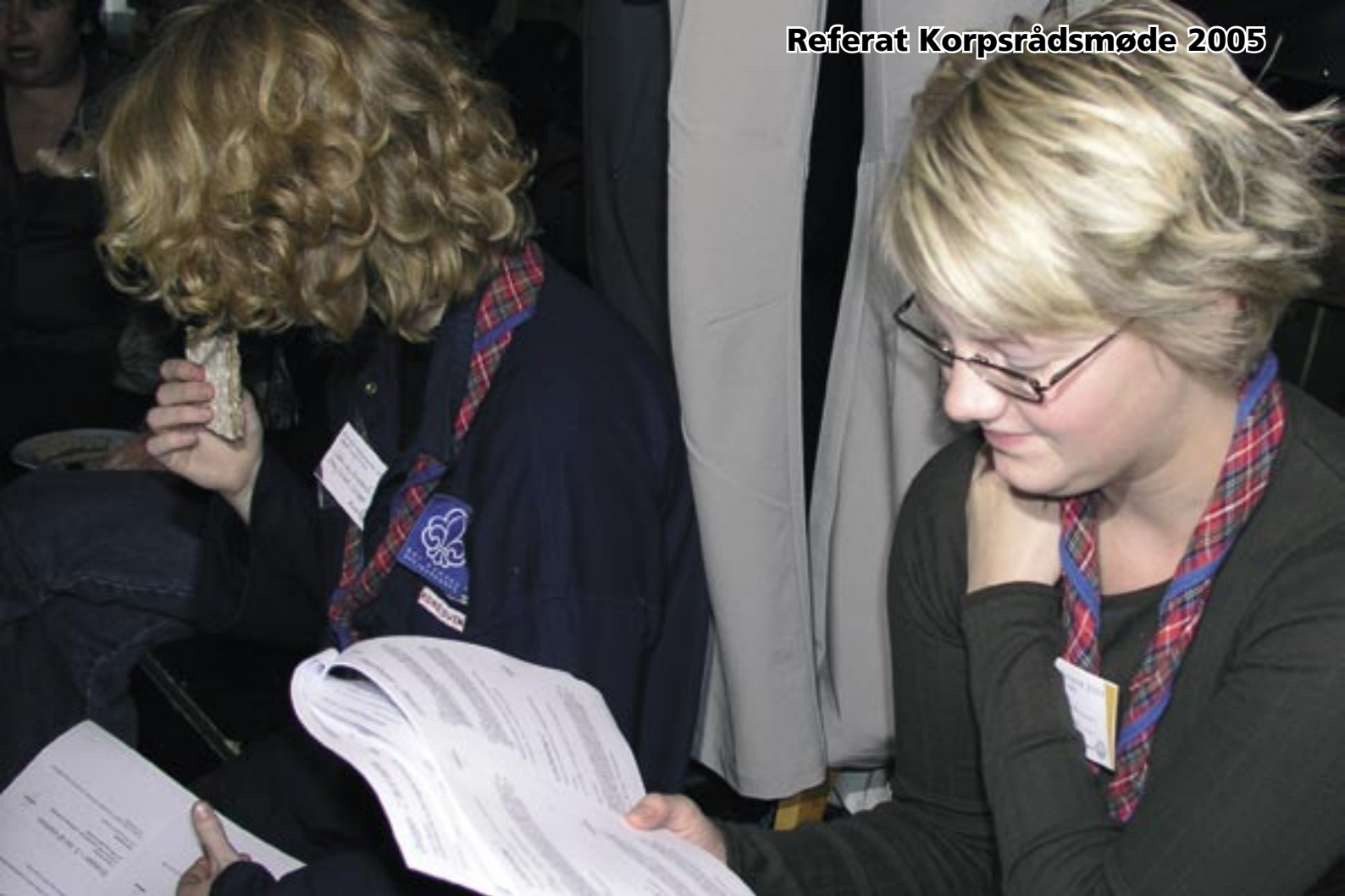
Lovforslag blev uddelt sammen med morgenmaden søndag morgen.