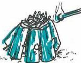
Det kan også tændes i toppen, så udvikles der mindre røg. Bålet brænder roligere og kan fra starten være klar til flere timers brænding.