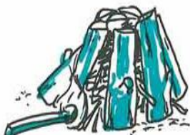
Bålet kan også bygges helt færdigt og tændes i bunden.