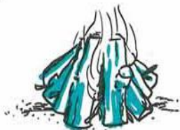
Når der er ild, lægges tykke stykker på.