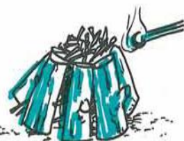
Det kan også tændes i toppen, så udvikles der mindre røg. Bålet brænder roligere og kan fra starten være klar til flere timers brænding.